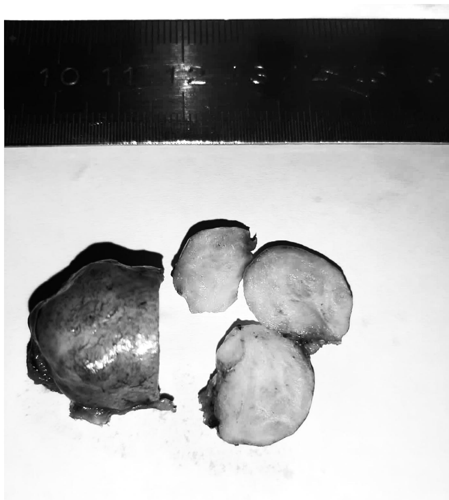
Рис. 1. Операционный макропрепарат удаленной морцеломы Fig. 1. Removed during operation morcellomas

Результаты патологоанатомического описания макропрепарата: ткань представлена плотным бугристым узлом, овоидной форм 2,7х2см, белого цвета, волокнистого вида. Заключение патогистологического исследования: В исследуемом послеоперационном препарате микроскопическая картина узла лейомиомы (матки) типичного строения в тонкой фиброзной капсуле, образованной фиброзно-мышечными пучками, разделенными грубыми фиброзными пучками с гиалинозом (рис. 2 а,б,в).